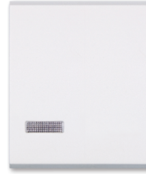
4. jednopolna 2M sa indik., ukrasna sa indikacijom (art.678, 671, 6590I, 6600I)