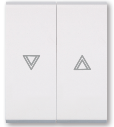
5. sklopka za roletne (art.690)